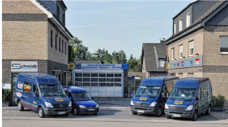
Immer einsatzbereit: Die Ernst Schmidt-Fahrzeugflotte.