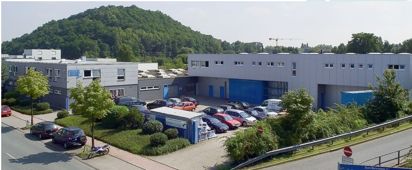
Der Hauptsitz der FELDER GmbH.